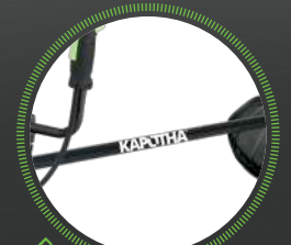
BARRA DE 28 MM

Embrague tipo centrífugo de alto rendimiento.